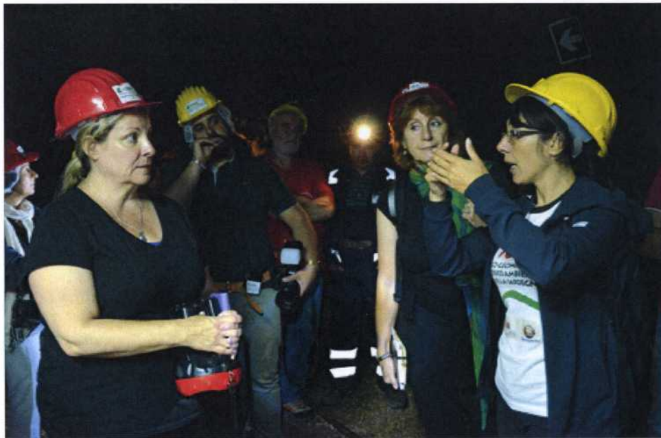
Le delegate in visita agli impianti della Miniera di Sos Enattos